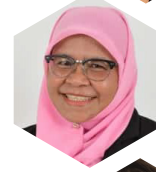
Maimunah Binti Mohd Sharif Directora ejecutiva, programa de las Naciones Unidas para los Asentamientos Humanos