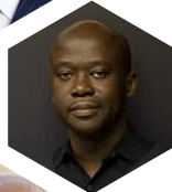
Sir David Adjaye OBE Fundador y director, Adjaye Associates