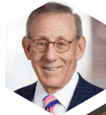
Stephen Ross PRESIDENTE DEL JURADO Presidente y fundador, Compañías Related

El jurado del Premio a las Ciudades es distinguido grupo de líderes urbanos y visionarios. La selección de las personas miembro del jurado se basa en su reconocida experiencia y especialidad para seleccionar a los cinco proyectos finalistas a través de un proceso deliberativo.