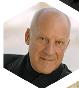
Lord Norman Foster Fundador y presidente ejecutivo, Foster + Partners